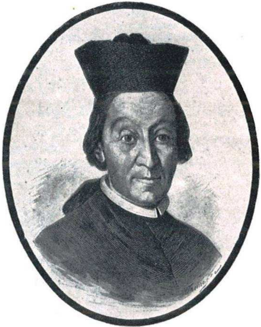
Cardenal Benet de Sala