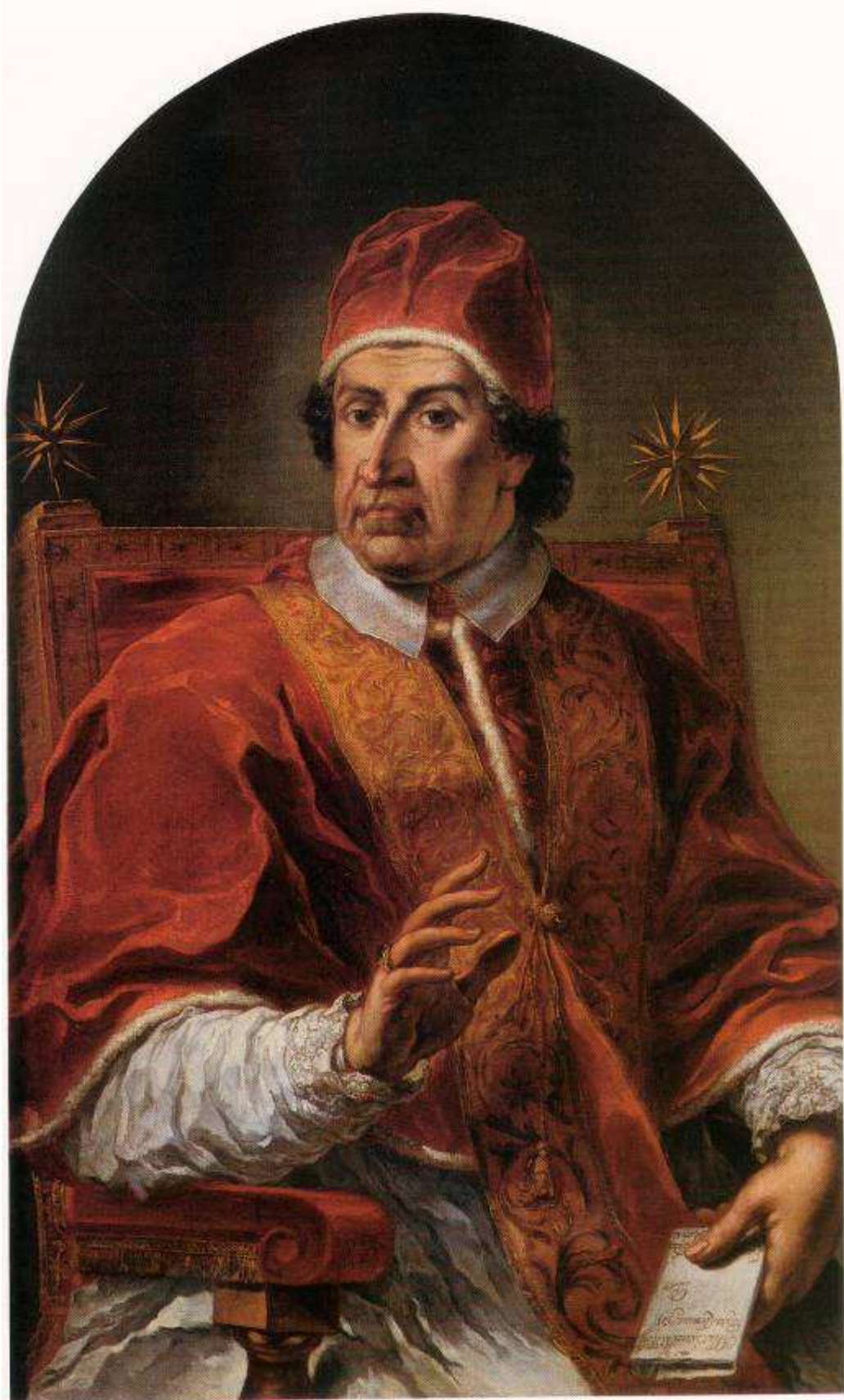
Retrat de Climent XI