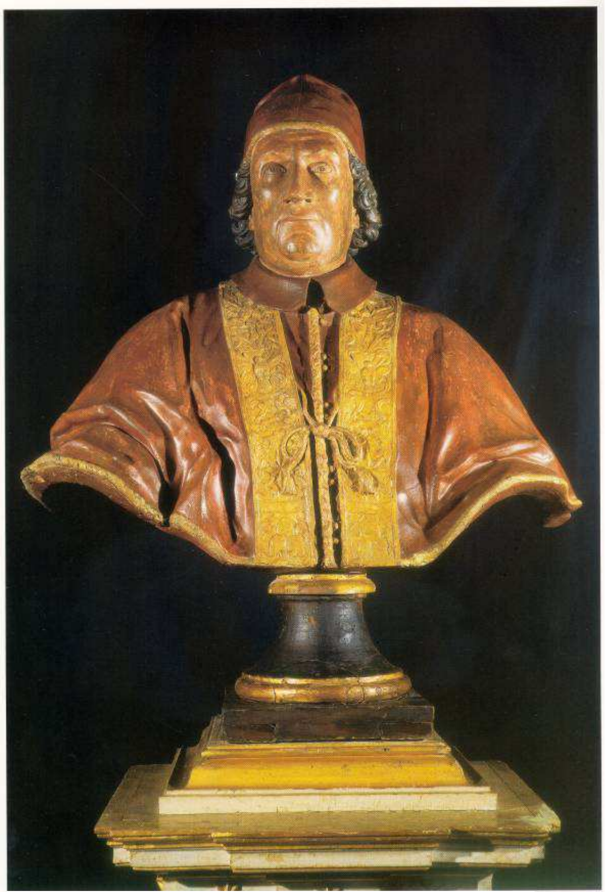
Retrat de Climent XI