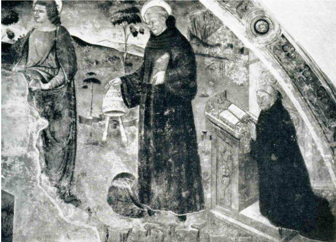
Celestí V, papa