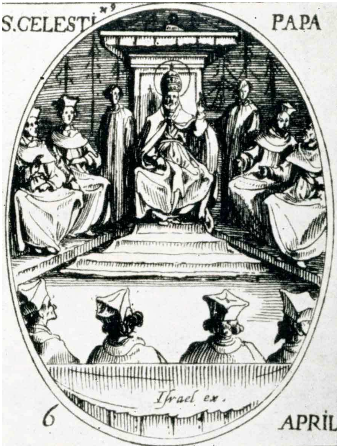
Celestí I, papa