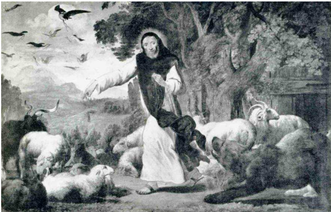
Celestí V, papa